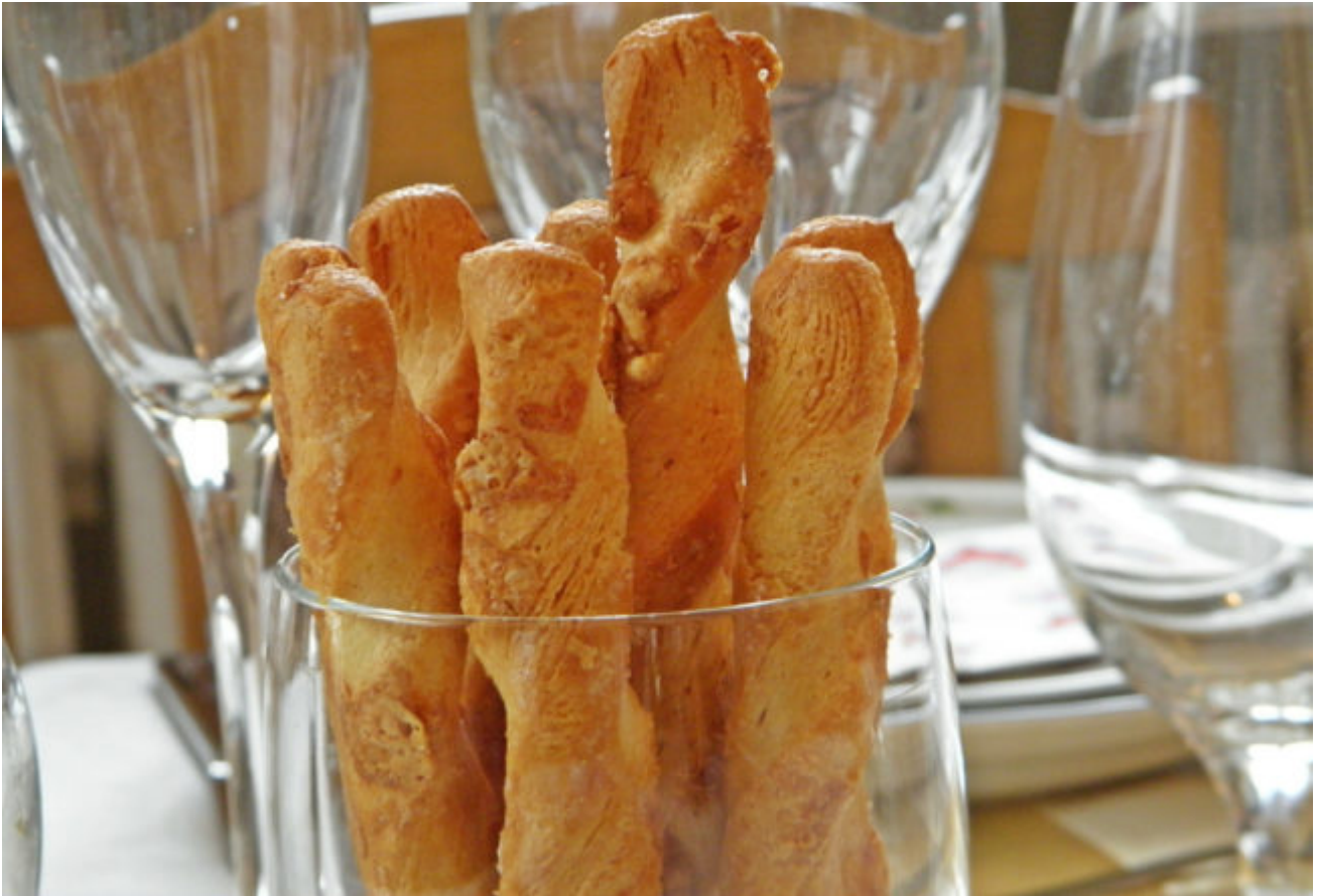
Käsestangen aus Blätterteig