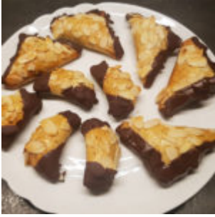
Mandelhörnchen mit Hefe