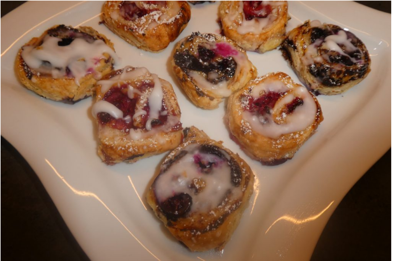
Blätterteigschnecke mit Kirsch- oder Erdbeer- und Puddingfüllung