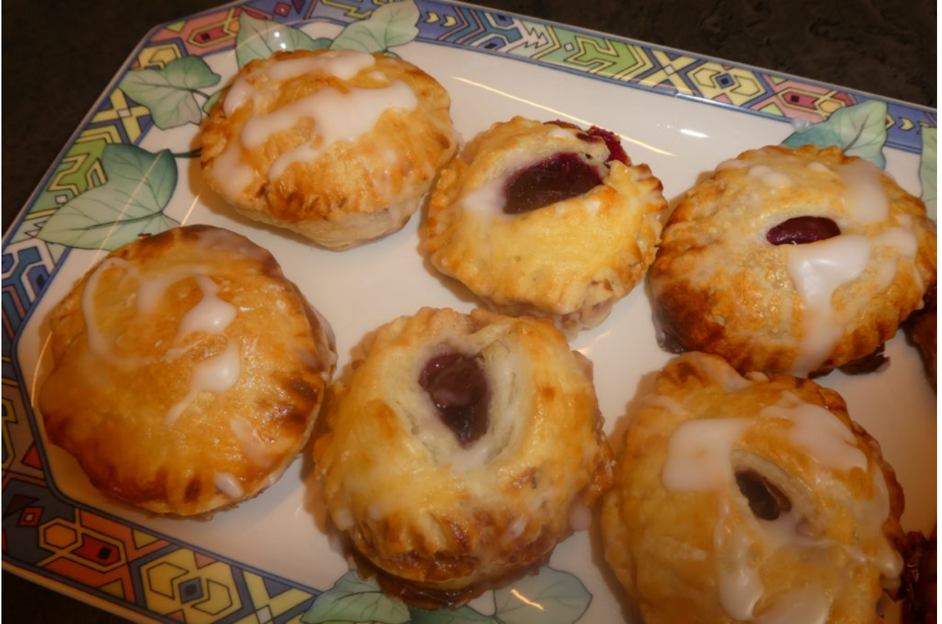
Blätterteiggebäck mit Kirschfüllung