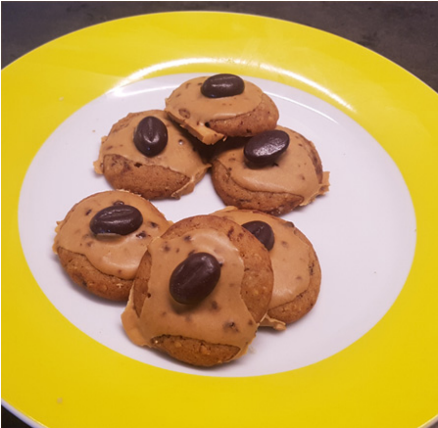
Kaffee – Taler